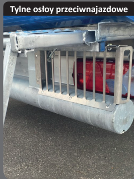
Tylne osłoy przeciwnajzdowe

Układ jezdny ze wzmocnionymi osiami (OFF ROAD) z błotnikami