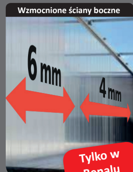
Wzmocnione ściany boczne

Wzmocniona ruchoma przegroda wewnętrzna (6 mm) ze wzmocnioną plandeką