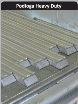
Podłoga Heavy Duty

Wzmocniona podłoga (płaska lub żebrowana) grubości 10mm lub 8/18mm bardzo odporna na uderzenia, (możliwe profile zachodzące)