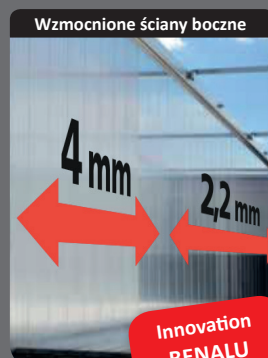
Wzmocnione ściany boczne

Zindegnowana struktura w 100% aluminium dla zapewnienia zwiększonej sztywności