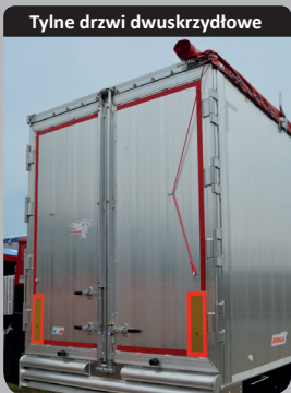
Tyłne drzwi dwuskrzydłowe

Dwa rygle zamykające (po jednym na stronę). Spawy ciągłe, wzdłużny zderzak