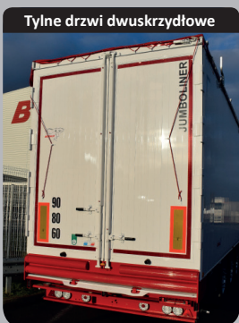
Tyłne drzwi dwuskrzydłowe

Aluminiowe ściany podwójne, wewnętrznie wzmocnione przez spaw ciągły, modułowa grubość wewnętrznych profili