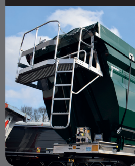
Passerella 100% in alluminio

Passerella larga e sicura con base d'appoggio per ispezione del carico