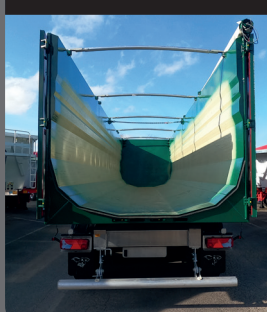
Scarico materiale senza ostacoli

Scarico privo di ostacoli per operazioni in sicurezza