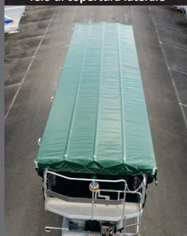
Telo di copertura laterale

Telo di copertura laterale con cinghie di rinforzo per materiale abrasivo