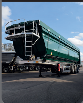
Cassa in Acciaio THEL HB 450

Alta resistenza all'impatto e alle abrasioni grazie alle migliori leghe sul mercato