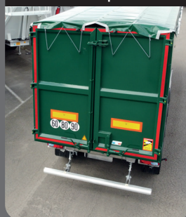
Porta a doppio battente senza traversa superiore

Porta a doppio battente priva di traversa superiore per uno scarico in sicurezza