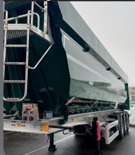
Piastre di metallo piegate longitudinalmente

Rigidità impressionante con speciale attenzione a preservarne la portata utile