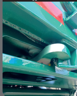
Sbloccaggio a distanza

Perni di bloccaggio con comando a distanza