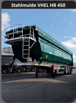
Stahlmulde VHEL HB 450

Hohe Schlag- und Abriebfestigkeit dank der besten Legierungen auf dem Markt