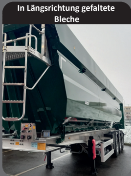
In Längsrichtung gefaltete Bleche

Entladen ohne Hindernisse und in absoluter Sicherheit!