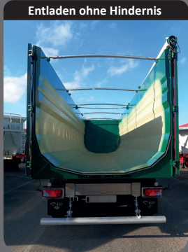
Entladen ohne Hindernis

Pneumatisches Fernentriegeln der Verriegelungsstangen