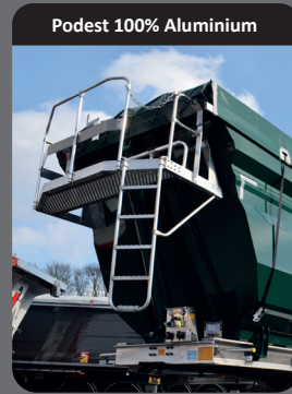
Podest 100% Aluminium

2 Flügeltüre ohne obere Traverse, welche eine erhöhte Entladesicherheit bietet