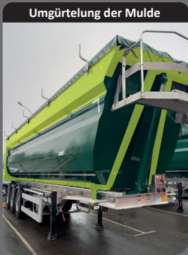
Umgürtelung der Mulde

Hohe Schlag- und Abriebfestigkeit dank der besten Legierungen auf dem Markt