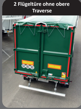
2 Flügeltüre ohne obere Traverse

Bemerkenswerte Steifigkeit unter Beibehaltung der Nutzlast