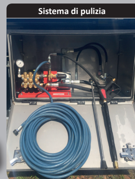
Sistema di pulizia

Tramoggia fissa o rimovibile applicata sotto la porta posteriore