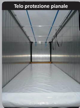
Telo protezione pianale

parete scorrevole interna rinforzata (spessore 6mm) con telo scopa.