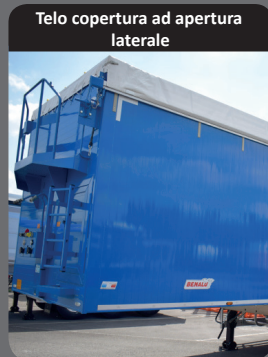
Telo copertura ad apertura laterale

Dimensioni studiate per facilitare l'ingresso nelle aziende agricole. Lunghezza totale 10m.