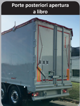
Porte posteriori apertura a libro

Porte posteriori con apertura a libro (semi-incassate). Saldature continue e paracolpi posteriori continui per il carico in ribalta.