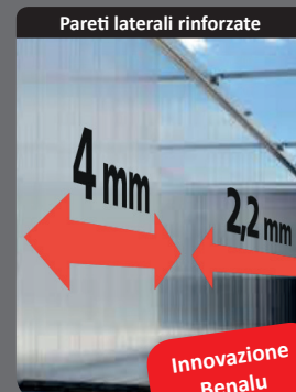
Pareti laterali rinforzate

Struttura continua 100% in alluminio del telaio per aumentare la rigidità.