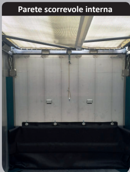
Parete scorrevole interna

Porte posteriori con apertura a libro (semi-incassate). Saldature continue e paracolpi posteriori continui per il carico in ribalta.