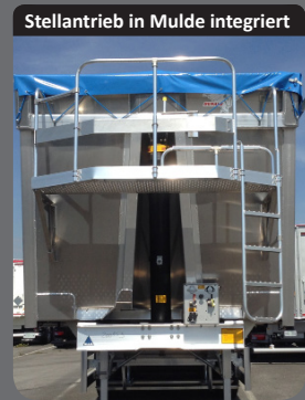
Stellantrieb in Mulde integriert

Sorgt dafür, dass kaum Produkte beim Kippen zurückbleiben und unterstützt die Entladung.