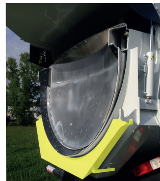
Becquet amovible qui optimise la retombée des enrobés