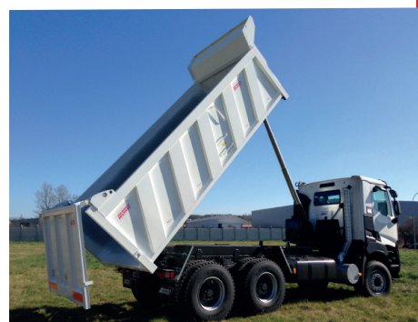
Berceau absorbeur de chocs breveté !