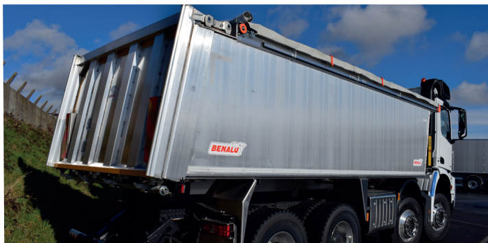
Version faces latérales en palplanche verticale non peinte.