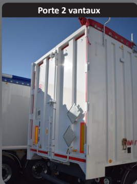
Porte 2 vantaux

Porte arrière 2 vantaux simple fermeture disposant d'un verrouillage à distance et d'un cadre renforcé.