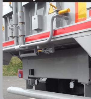
Déverrouillage de la porte à distance

Sécurité accrue grâce au déverrouillage à distance de la porte.