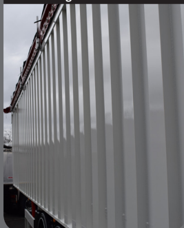
Doublage des raidisseurs

Profil de caisse à raidisseur doublés sur la partie arrière qui offre une minimisation de la déformation.