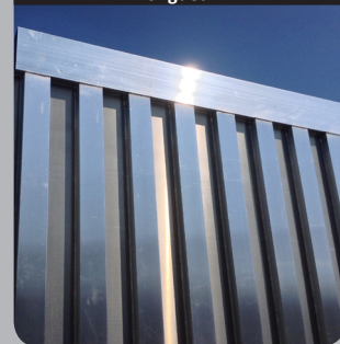
Doublage des raidisseurs sur toute la longueur

Doublage des raidisseurs sur l'ensemble des faces latérales afin d'améliorer la résistance.