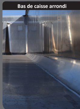
Bas de caisse arrondi

Angles arrondis qui limitent la rétention de produit au bannage et favorise l'écoulement.