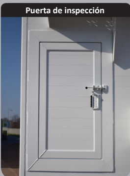
Puerta de inspección

Piso reforzado (liso o acanalado) de espesor 10mm o HDI de 8/18. Muy alta resistencia al impacto