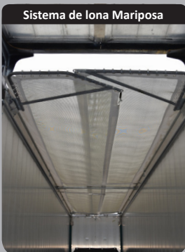
Sistema de lona Mariposa

Puerta de inspección estanca en el frontal con faro de trabajo de LED ajustable