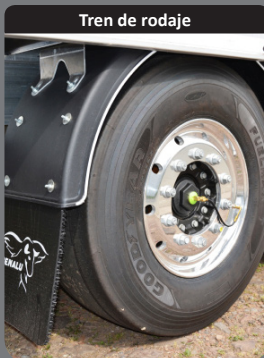
Tren de rodaje

Parachoques de acero galvanizado reforzado (distancia al suelo optimizada) con rejilla de protección de luces y escalera integrada.