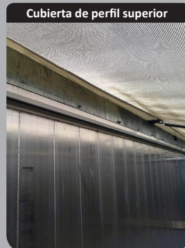
Cubierta de perfil superior

Sistema de lona Mariposa con mando hidráulico o manual, (Malla de PVC 4x4mm)