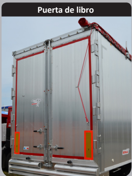
Puerta de libro

Puerta de libro semi-empotrada (2 barras de cierre). Soldadura continua y tope transversal continuo en la caja para acoplamiento al muelle