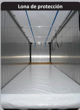
Lona de protección

Tabique interno reforzado (6 mm de espesor) con toldo reforzado