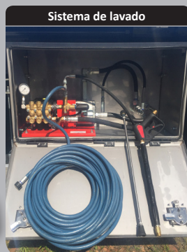
Sistema de lavado

Estación de lavado a bordo de baja presión o de alta presión (150 bar)