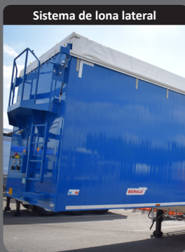
Sistema de lona lateral

Tren de rodaje equipado con ejes reforzados (OFF ROAD) y alas incrustadas