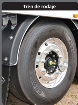
Tren de rodaje

Piso liso o acanalado en espesores de 6,8 ó 10 mm. Marco tubular y almohadillas de teflón