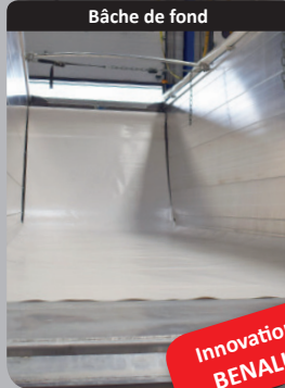
Bâche de fond

Dispositif de bâche de fond étudié pour faciliter l'écoulement des produits collants et assurer une totale sécurité (Brevet n°FR2976532)