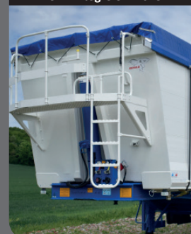
Verin intégré en niche

Vérin à oeil intégré en niche qui optimise le volume total !