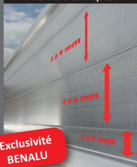
Faces latérales uniques !