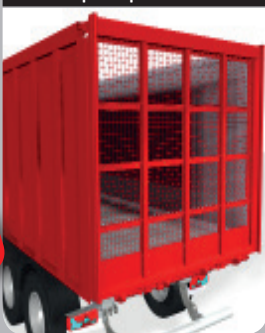
Porte spécifique Betterave

Porte innovante, spécifiquement conçue pour le transport de betteraves !