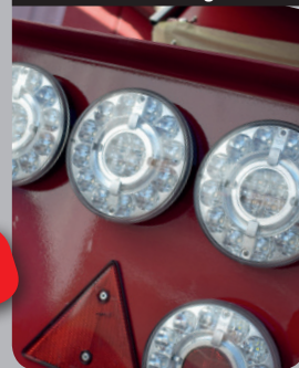
Feux LED design

Feux full LED qui offrent une consommation d'énergie et un design particulièrement réussi !