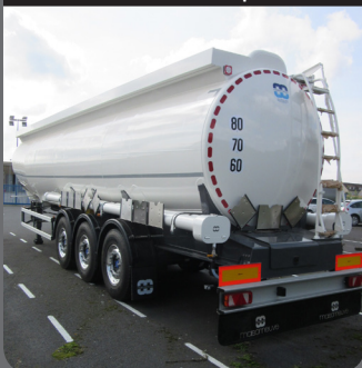
citerne aluminium 9 compartiments

Citerne atmosphérique aluminium compartimentée. Concept bitronconique à section circulaire.