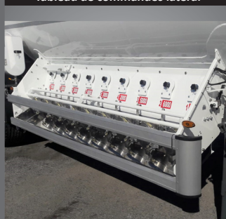
Tableau de commandes latéral

Indicateur de produit rotatif à 8 positions et phare de travail