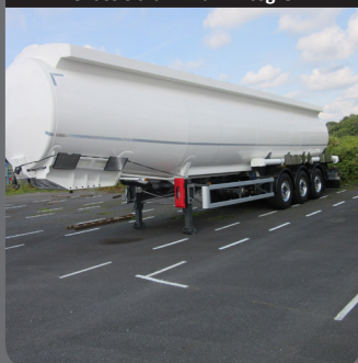
Châssis aluminium intégré

Châssis aluminium ultra léger intégré à la citerne