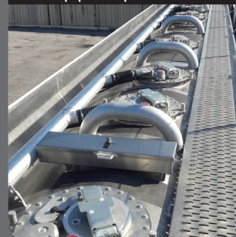
Équipement partie haute