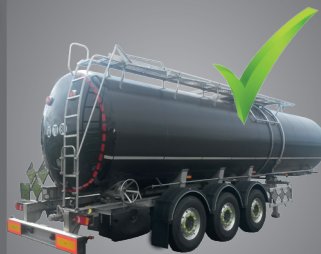
Conforme à la directive ADR

Véhicule répondant à l'ensemble de l'ADR