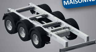
Châssis autoportant polyvalent

Citerne spécialement dédiée au transport de bitume, de pétrole et d'émulsion de bitume