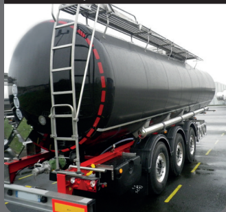
Citerne dédiée au transport de produit noir

Citerne spécialement dédiée au transport de bitume, de pétrole et d'émulsion de bitume