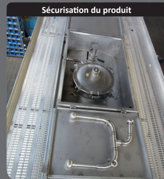
Sécurisation du produit

Condamnation de tous les accès de la citerne