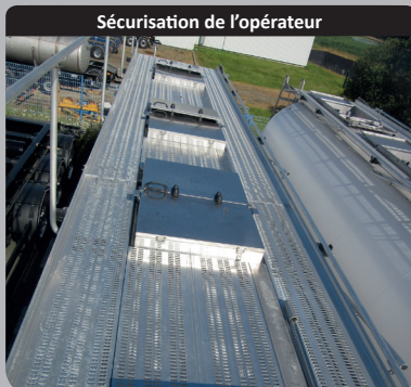
Sécurisation de l'opérateur