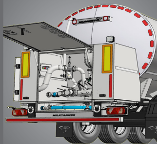
Poste de travail ergonomique

Poste de travail «tout à l'arrière». Ergonomie garantie !