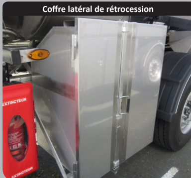
Coffre latéral de rétrocession

Coffre latéral pour l'approvisionnement de vos producteurs. Version isolée en option