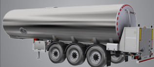
Groupe de pompage autonome

Groupe de pompage E-DIGIMILK alimenté par batterie lithium-ion