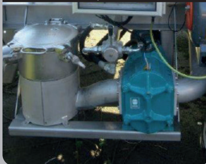
Pompe à lobe

Fourniture et pose d'une pompe à lobe avec piège à cailloux en amont