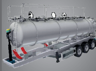
Châssis col de cygne

Châssis col de cygne BENALU qui diminue la hauteur du centre de gravité de 95mm et améliore la stabilité.