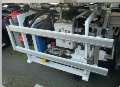
Lavage haute pression

Fourniture et pose d'un groupe de lavage haute pression