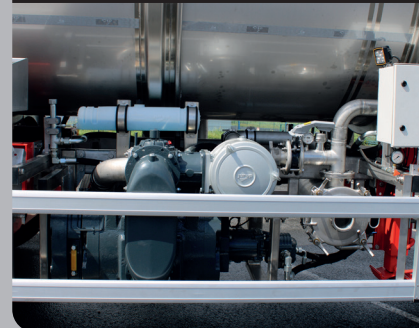
Groupe de vide

Fourniture et pose du groupe de vide à entraînement hydraulique