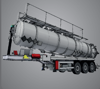
Véhicule bennable !

Citerne bennable qui améliore le déchargement du produit et le lavage